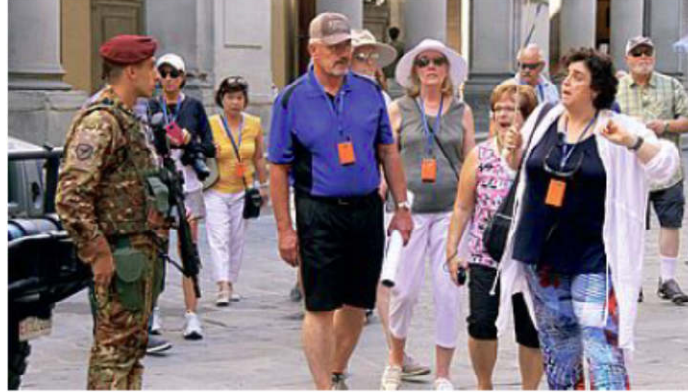
Il centro storico di Firenze è presidiato da alcuni mesi da un contingente di militari appositamente inviati per controllare le piazze

IL CONTROLLO aveva portato alla scoperta di un file video in possesso del giovane: un video che gira sulla rete, in inglese, in seguito tradotto anche in italiano, in cui si vedono uomini neri del Califfato che annunciano e danno seguito a esecuzioni di prigionieri, in cui si sentono annunci intervallati a eser-